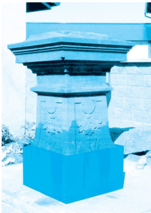
Impregnování spodní části podnože pomníku sv. Ondřeje roztokem organokřemičitanů

Zahrada školky. Po opravě opěrné zdi mezi chodníkem a školkou se dělaly ještě další úpravy. Jednak OZET opravil zábradlí nad chodníkem a vstupní bránu, za druhé je dokončeno oplocení horní zahrady školky a za třetí se na horní zahradě provedly terénní úpravy, díky kterým tam vzniknou rovná místa pro herní