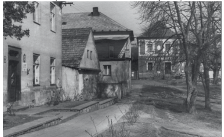
Ondřejovská škola v 60. letech

Poštovní úřad se do nového domu nastěhoval 25. dubna 1927. Krátce poté, 5. května 1927, byla na tomto úřadě zřízena veřejná telefonní hovorna „k použití všemu obecnstvu“, jak se píše v kronice. Obec na tuto hovornu přispěla částkou 5 400 Kč. Když už je řeč o telefonu: první telefonní linka do Ondřejova byla zavedena