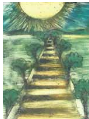
1. Ondřejov náměstí, společná práce žáků 4. B