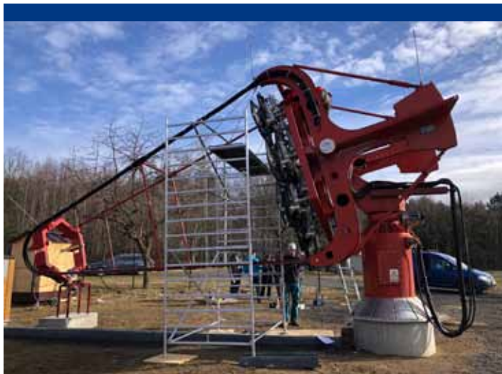
Stavba druhého dalekohledu SST-1M (foto: Vladimír Karas/archiv Astronomického ústavu AV ČR).