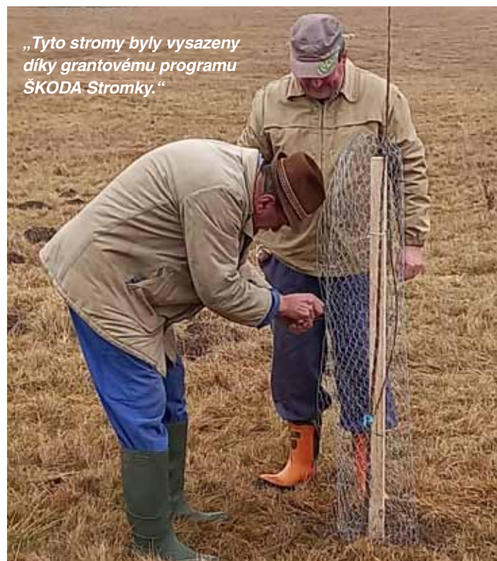
„Tyto stromy byly vysazeny díky grantovému programu ŠKODA Stromky.“