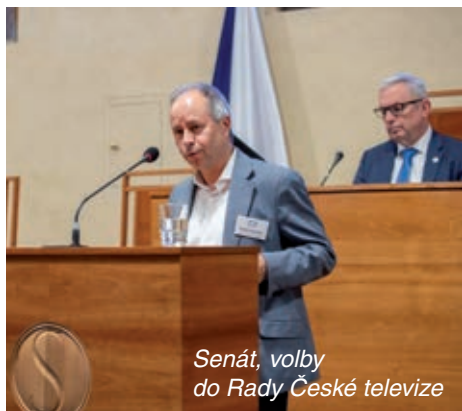
Senát, volby do Rady České televize