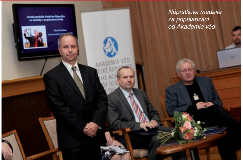
Náprstkova medaile za popularizaci od Akademie věd

dovat. Z druhé strany tatínek mojí maminky byl kapelník u Kmocha, bydlel v Plaňanech u Kolína. To byla naopak muzikální rodina, já si pamatuju, kdy jsem potom, ne už do Plaňan, ale do Rudníku u Hostinného, jezdil za babičkou a dědou, děda tam vyučoval již jako starej pán. Na hudební výchovu dojížděli kluci a holky, bavilo mě, když přijela nějaká slečna na výuku. Tam jsem měl asi šanci pochytil nějaký hudební talent, ale to se nestalo. Umím hrát jen na nervy.