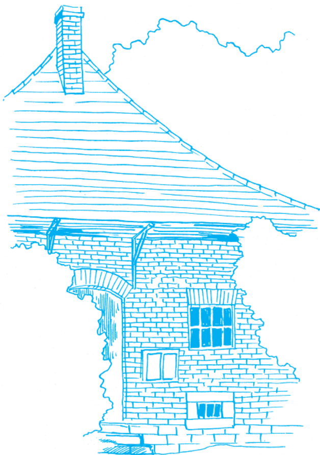
Hvězdárna - domek pro zahradníka z počátku 20. století. Kresba Lukáš Martinka

Ondřejov je dnes významným kulturním centrem, kde je mnoho příležitostí pro trávení volného času, pro kulturu, sport i vzdělání. Chceme v tomto trendu pokračovat. Velkou podporu budeme i nadále dávat základní a mateřské škole, stejně jako místním spolkům. Sportovně-kulturní centrum je díky svému manažerovi úspěšné i ekonomicky, nedostává už žádný příspěvek od obce, obec jen platí energii v kulturním domě a mandátní odměnu.