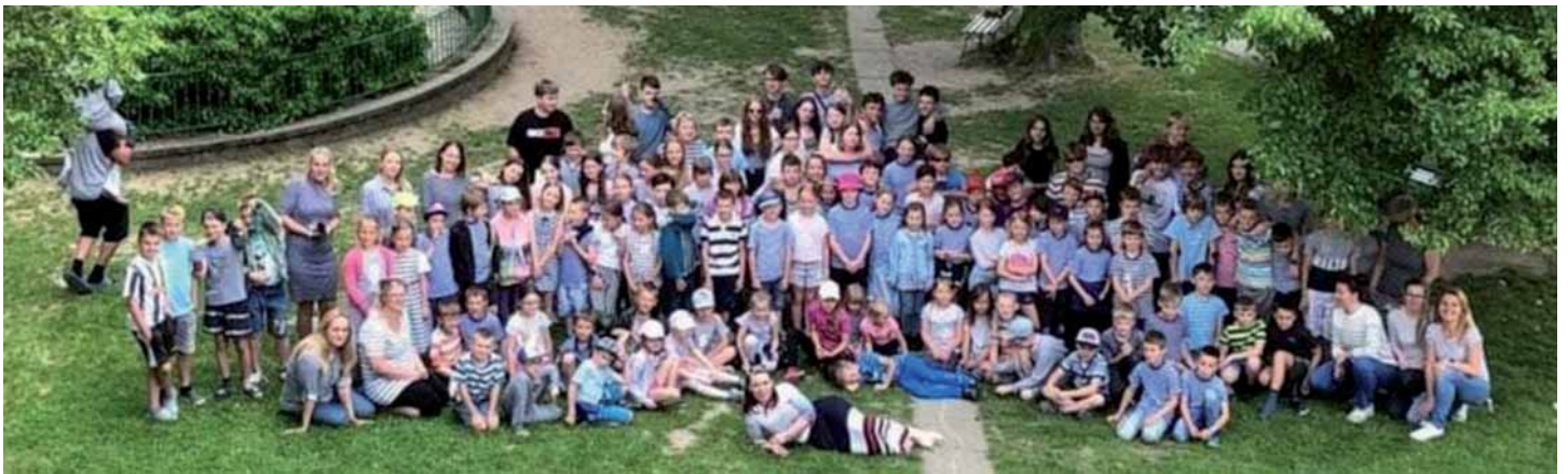
Prosím, omluvte zhoršenou kvalitu fotografie.

Každý rok můžeme první červnový pátek potkávat v Ondřejově obrovskou spoustu dětí i dospělých v proužkovaném oblečení. Letos to bude už poosmé. Ptáte se proč? Pražské sdružení Za novým úsměvem zavedlo v roce 2017 krásnou tradici a vyhlásilo první červnový pátek jako Den českých rozštěpových pacientů.