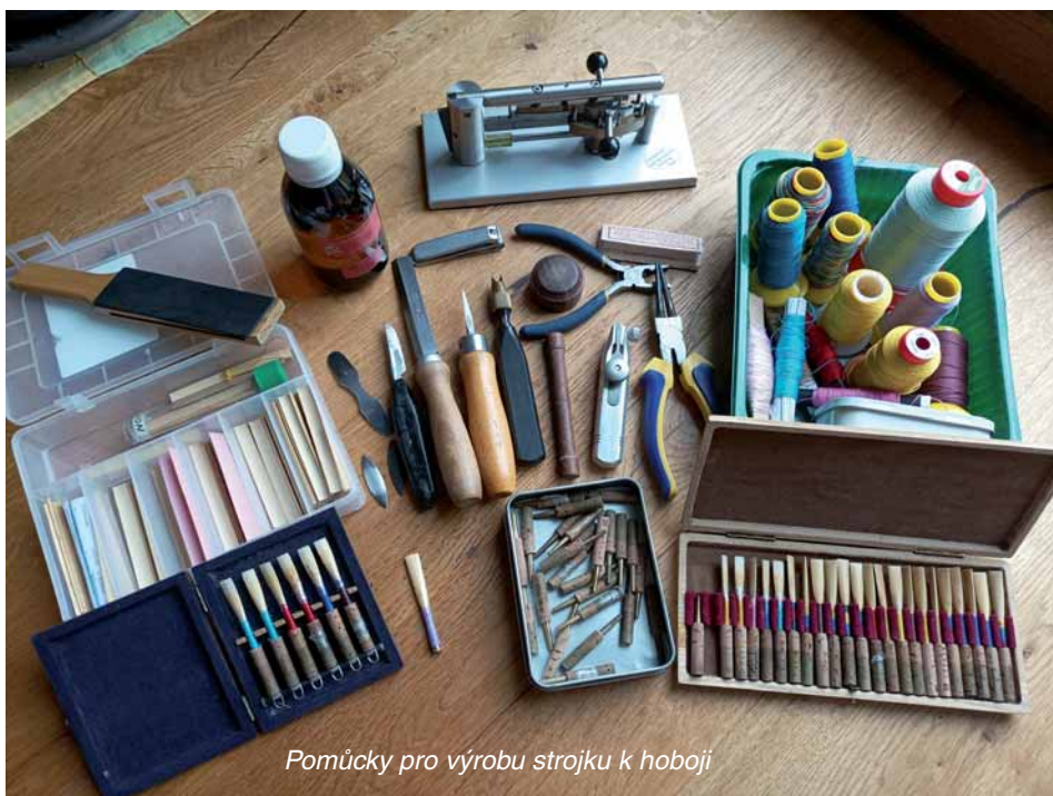
Pomůcky pro výrobu strojku k hoboji

Kamila: „Myslím si, že je hodně ovlivňující prostředí, ve kterém vyrůstá. Pokud je dítě od malička obklopeno hudbou, nej-