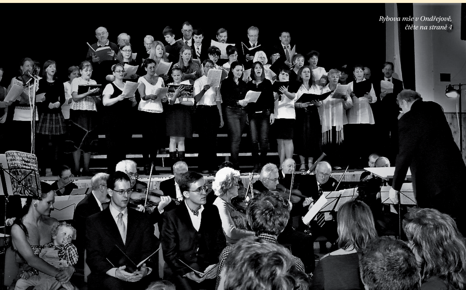
Rybova mše v Ondřejově, čtěte na straně 4