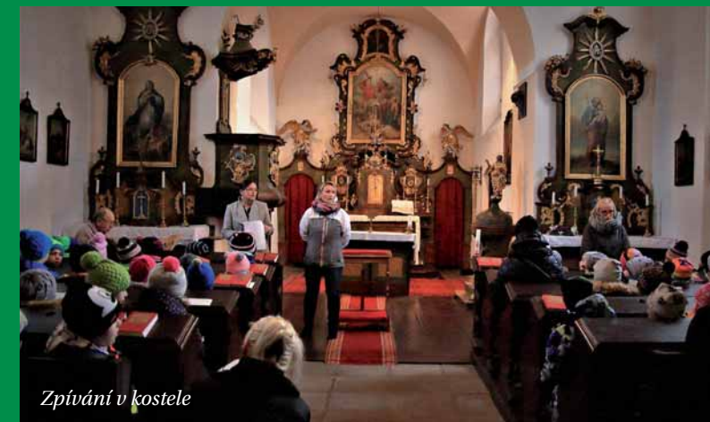
Zpívání v kostele