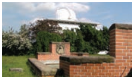
Kopule Slunečního oddělení na ondřejovské hvězdárně

Procesy vedoucí k formování sluneční koróny jsou i dnes do značné míry nevysvětlené, nicméně systematické pozorovací