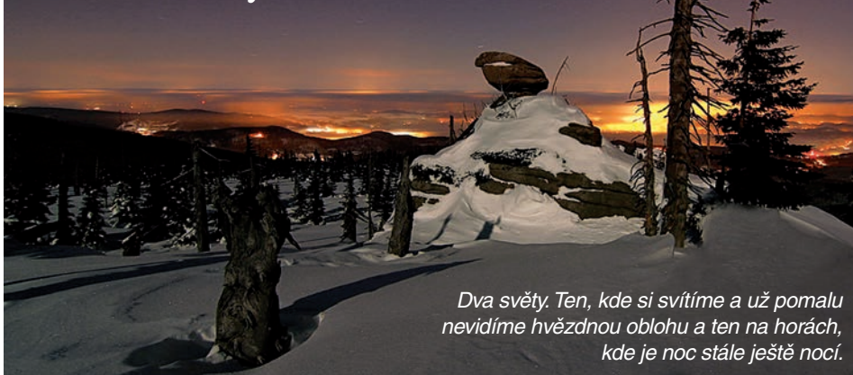
Dva světy. Ten, kde si svítíme a už pomalu nevidíme hvězdnou oblohu a ten na horách, kde je noc stále ještě nocí.