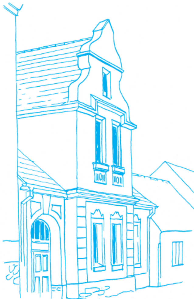
Dům čp. 5 na náměstí v Ondřejově z počátku 20. století. Kresba Lukáš Martinka