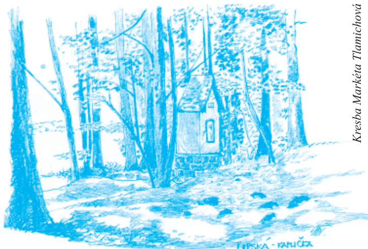
Kresba Markéta Tlamichová