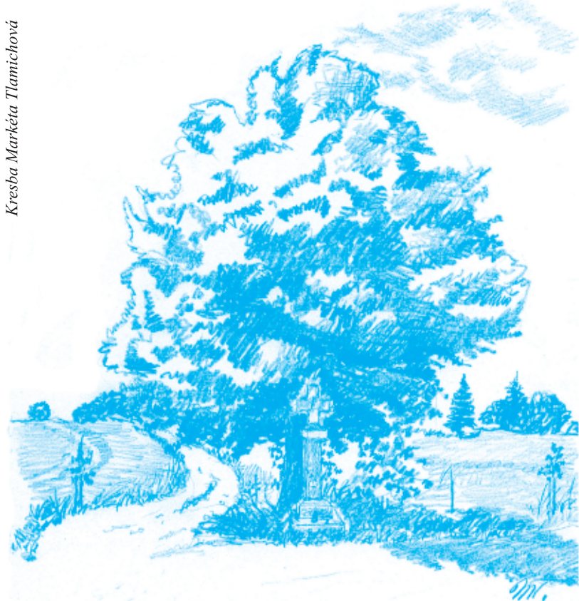
KAMENNÝ KRÍŽ U SILNICE DO TURKOVIC