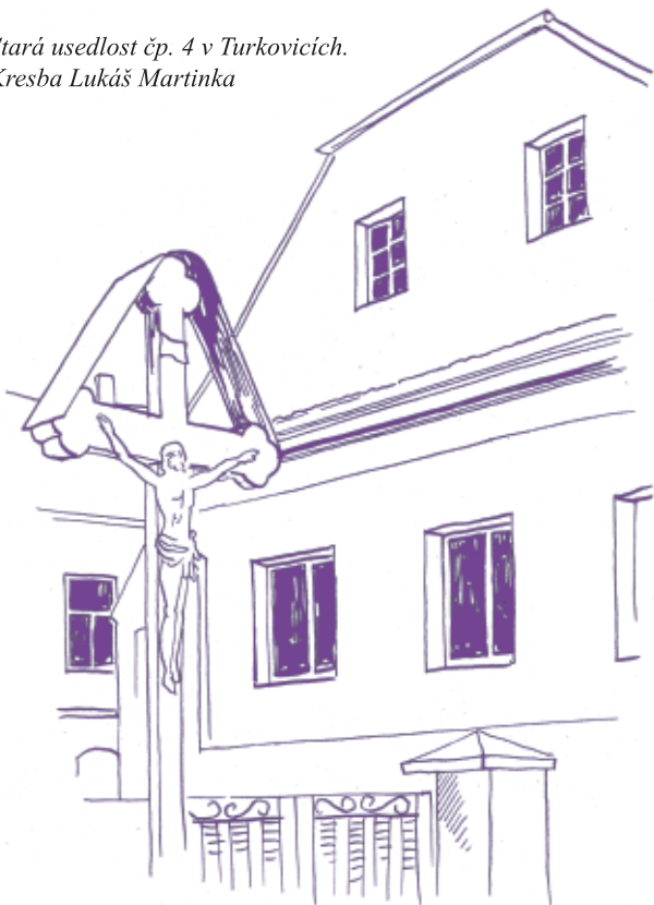
Stará usedlost čp. 4 v Turkovicích. Kresba Lukáš Martinka