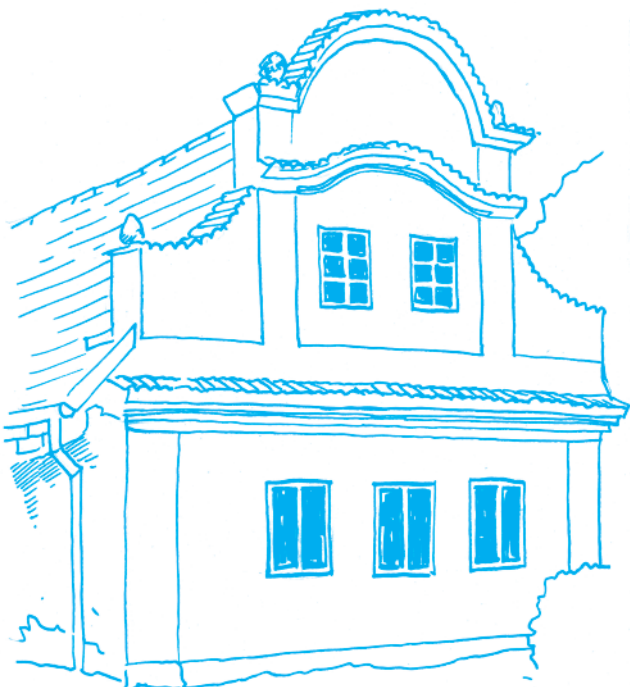
Barokní dům čp. 26 z konce 18. století v Ondřejově. Kresba Lukáš Martinka

Volby do zastupitelstva obce jsou za dveřmi, končí volební období, o vaše hlasy se ucházejí všechny volební strany. Jednou z nich je i naše strana Ondřejov-Třemblaty-Turkovice, která v minulých volbách získala nejvíc hlasů. Máme tedy největší odpovědnost a musíme skládat účty. Podívejme se proto, co se za uplynulé čtyři roky podařilo a co ne. Protože paměť je krátká, procházeli jsme výdaje z účetnictví za poslední 4 roky a vybírali jsme z nich jen ty, které byly spojeny s novými věcmi nebo s většími