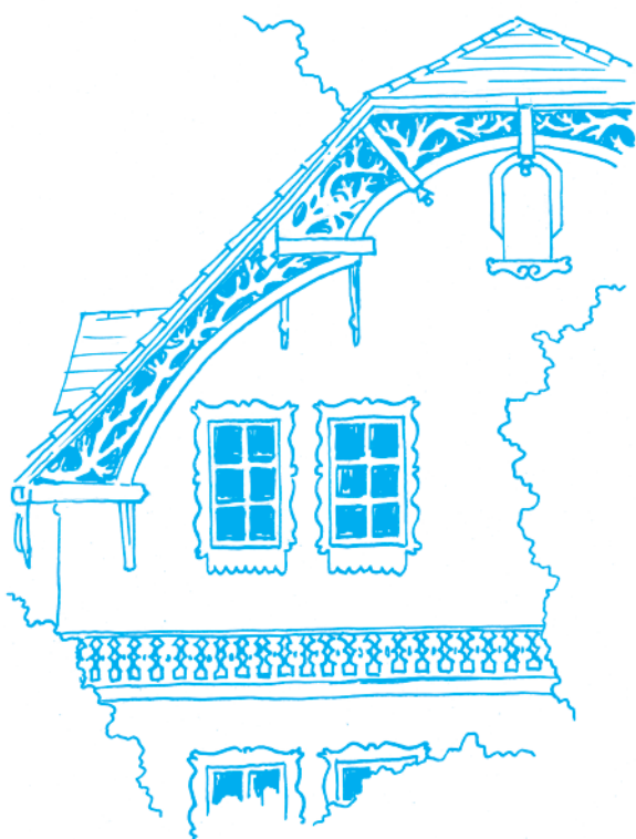
Vila čp. 146 v Ondřejově z konce 19. nebo počátku 20. století. Kresba Lukáš Martinka

Hlavní akcí roku 2009 byla jednoznačně rekonstrukce a zateplení kulturního domu a jeho vybavení tepelným čerpadlem; k tomu byly doprovodné výdaje na další opravy a na vybavení. Na to jsme dostali dotaci přibližně 3,5 milionu. Druhou nákladnou akcí byla rekonstrukce bývalého obecního úřadu v Průběžné na školní družinu (nová okna, sociální zařízení včetně sprchy, nové instalace vodovodu, kanalizace a elektro). Obě budovy bylo nutné zrekonstruovat ze dvou důvodů. Za prvé, byly dost zchátralé: hrubá stavba sice vydrží staletí, ale třeba okna v bývalém obecním úřadě se už nedala otvírat ani zavírat. A druhý důvod je ten, že jsme potře-