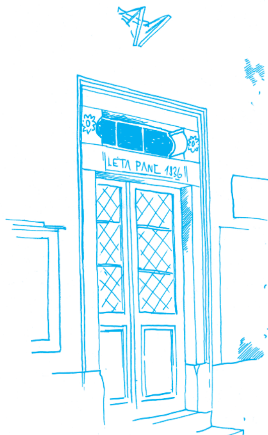
Klasicistní portál školy čp. 68 z roku 1836. Kresba Lukáš Martinka

Jak jsme hospodařili: přestože jsme koupili pozemek za 3,8 mil Kč, úspory na účtech obce poklesly v roce 2008 jen o 736 000 Kč na na 8,19 mil. Kč. Majetek obce vzrostl v roce 2008 o 4,6 mil. Kč, k tomu náš majetkový podíl v Regionu Jih vzrostl o dalších 337 000 Kč.