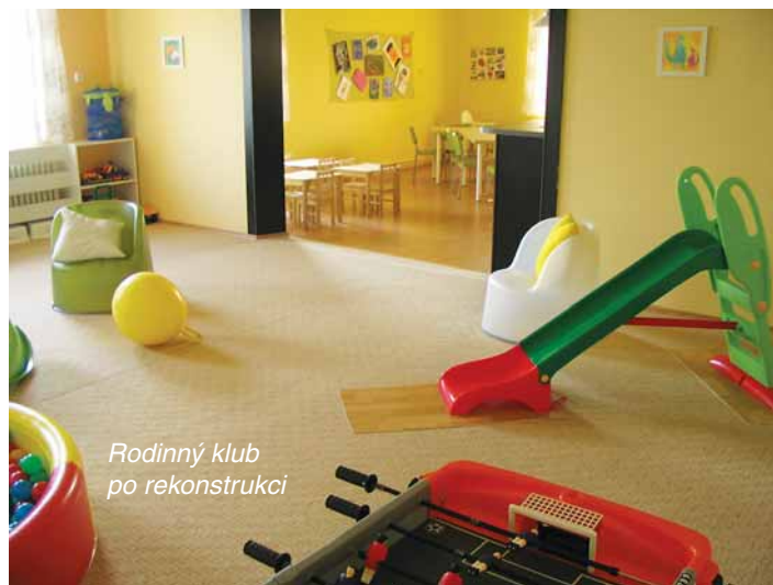
Rodinný klub po rekonstrukci