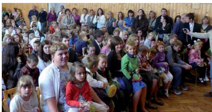
Deváťáci před nástupem do 1. třídy – slavnostní zahájení školního roku

https://www.msmt.cz/vzdelavani/stredni-vzdelavani/prijimani-na-stredni-skoly-a-konzervatore