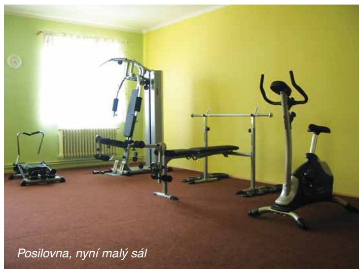
Posilovna, nyní malý sál

Začátky nebývají lehké, ale mě právě vymýšlení, hledání i společná práce moc bavily. Jak budou řešeny prostory, bylo to nejjednodušší. Těžší bylo finanční zajištění. Samozřejmě přispěla obec, našla jsem i sponzory (Mountfield, Flop i sousedy z naší ulice a další), zažádala jsem o dotace. Protože jsem pro žádost potřebovala nákresy prostor (to jsem ještě na PC neuměla), strávila jsem dva dny v IKEA, kde jsem vybrala veškeré zařízení včetně květinové výzdoby a hraček a tím pádem jsem dostala i plány prostor. Peníze postačily na realizaci rekonstrukce 1. patra (rodinné centrum s hernou a občerstvením, učebna, kancelář a malý sál s posilovnou). Dalším oříškem bylo, jaké kroužky vybrat a jak zajistit lektory. Anketa a kamarádi pomohli. Důležitým bodem byla i propagace. Bylo úžasné, jak se všichni zapojili včetně re-