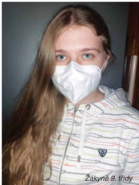
Žákyně 9. třídy