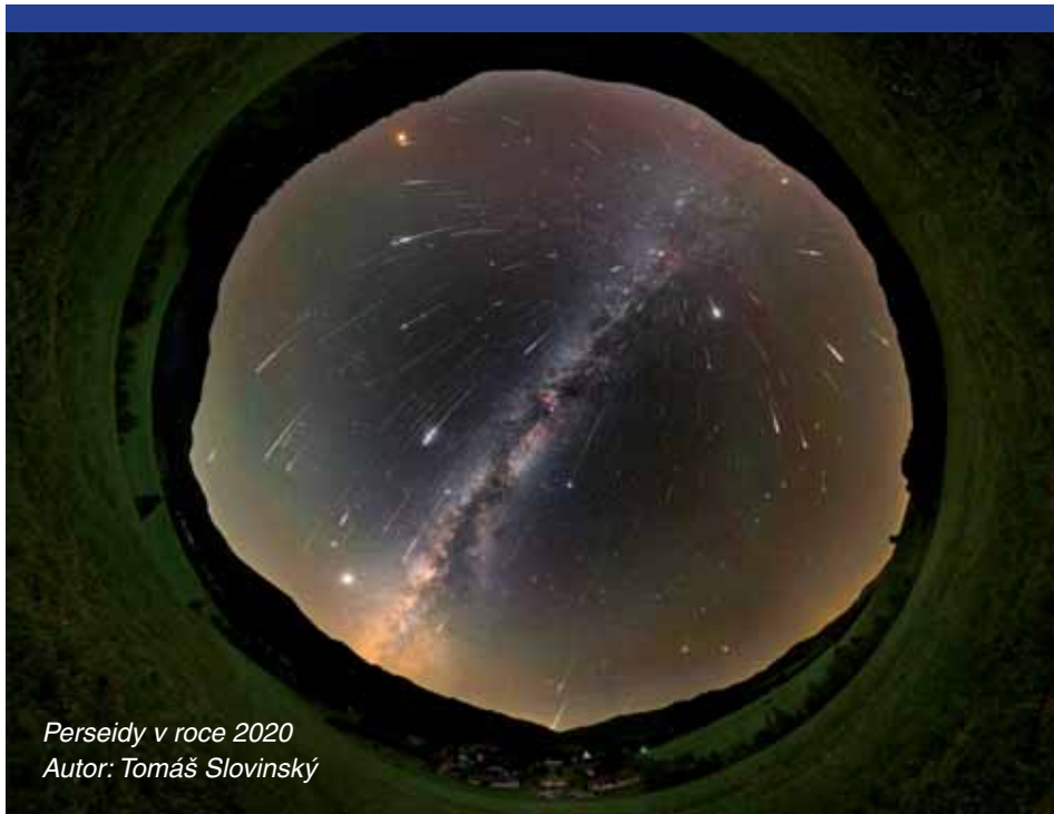
Perseidy v roce 2020

Definice přijatá IAU 24. srpna 2006 zmiňuje i satelity těles z těchto tří skupin, jako čtvrtou samostatnou kategorii. Mezi trpasličí planety dnes kromě Pluta počítáme také Ceres (největší těleso v oblasti mezi Marsem a Jupiterem) a relativně nedávno objevená tělesa za Neptunem – Eris, Haumea a Makemake. Kromě toho mají astronomové několik dalších vážných kandidátů na povýšení mezi trpasličí planety (rozhodující bude jejich tvar). Například Sedna, Orcus, Quaoar či Gonggong. Posledně jmenované těleso bylo objeveno v roce 2007 a získalo svůj definitivní název až v únoru roku 2020.