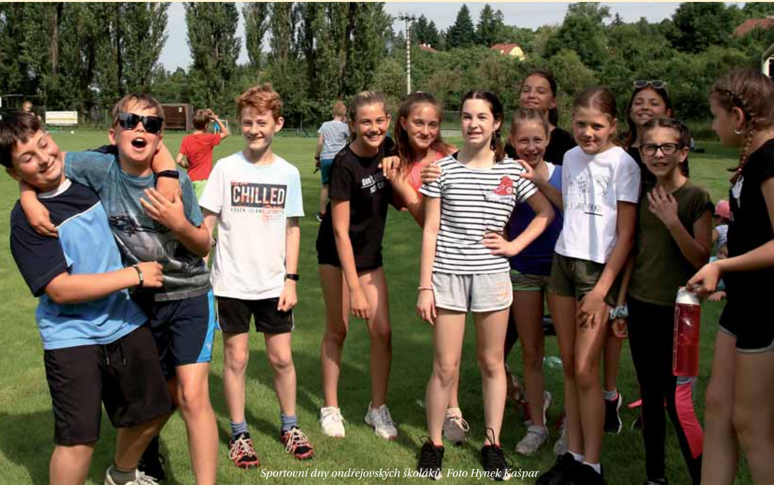
Sportovní dny ondřejovských školáků.