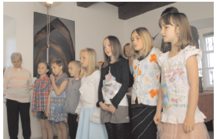
Děti ze školní družiny vítají v ondřejovském mlýně nové občánky

Druhé vystoupení na sebe nenechalo čekat. V neděli 11. května odpoledne se nás na oslavu Dne matek sešlo padesát. Pro naše maminky jsme si připravili pásmo „Jak vypadala vesnice a co se v ní dělo v minulém století“. Pořad byl proložen písničkami, dokonce jsme i zatančili. Dětem, maminkám i ostatním hostům, pro které tuto akci uspořádala Obec baráčnicků, se naše vystoupení moc líbilo.