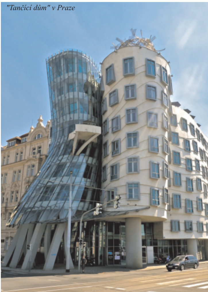
"Tančící dům" v Praze

Téma o architektuře vzniklo náhodou a neplánovaně a postupně nám prolínalo celým rokem. Povíдали jsme si nejen o Tančícím domě, ale i o Kaplického knihovně, gotických i barokních kostelích. Děti se aktivně zapojily do výtvarného zpracování Tančícího domu. Bez jakékoliv šablony vystříhly dům a nalepily ho na papír, pak tuší dokreslily okna a sloupy. Byla jsem velmi překvapená, jaká krásná díla vytvořily.