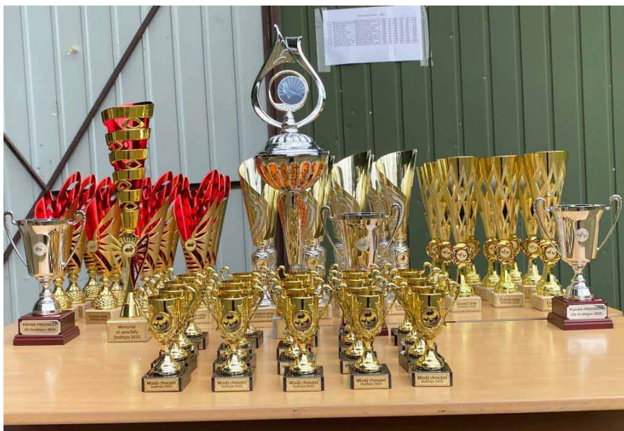
Odměny pro šampiony výstavy

Výstava spolku se nekonala od jeho založení pouze třikrát – v roce 1968 z politických důvodů, v 80. letech z důvodů veterinárních a v roce 2014 z důvodu stěhování celého zázemí spolku na nové „výstaviště“, a to do „podhradí“ ondřejovské hvězdárny, kde si návštěvníci výstavy mohou zpestřit den i krásnou procházkou areálem hvězdárny.