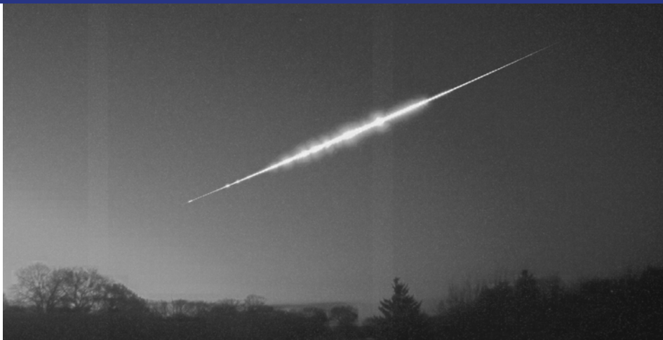
Složený snímek z videozáznamu bolidu ze 7. listopadu 2025 pořízeného videokamerou ze stanice Evropské bolidové sítě ve Veselí nad Moravou. Na snímku je bolid viditelný jako dominantní objekt s několika výraznými zjasněními na světlé obloze nízko nad jižním obzorem.

Přesně ve 4 hodiny 56 minut a 34 sekund světového času vstoupil do zemské atmosféry malý meteoroid (dále značený také jako EN071125_045634) o hmotnosti jen o málo víc než jeden kilogram a začal svítit natolik, že byl již zaznamenanitelný našimi kamerami, i když bylo na většině míst již pokročilé svítání. Bylo to ve výšce 108,3 km