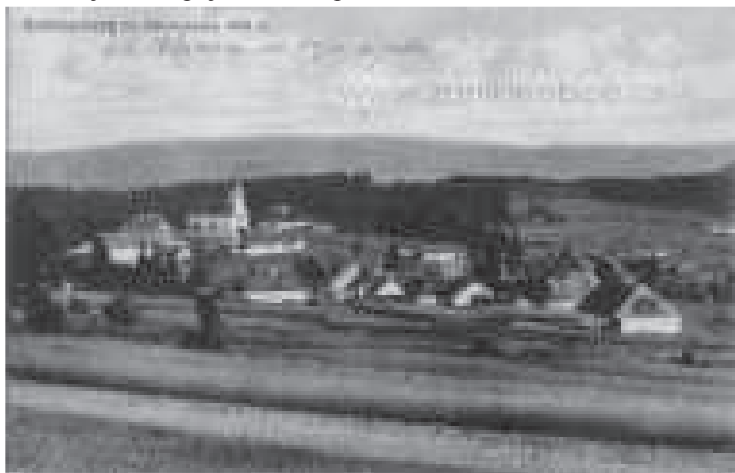
Takto kdysi vypadala obec Ondřejov u Českého Krumlova

Ondřej Trojer (též Andreas Troyer; 1648 Kralovice – 1699 Plasy) je zajímavá postava. Jako opat cisterciáckého kláštera v Plasích (1681 – 1699) započal barokní přestavbu kláštera novou stavbou prelatury a sýpky, nechal přestavět poutní kostel v Mariánské Týnici. Na místech zaniklých vsí založil obce Trojany a Ondřejov, obě pojmenované po něm.