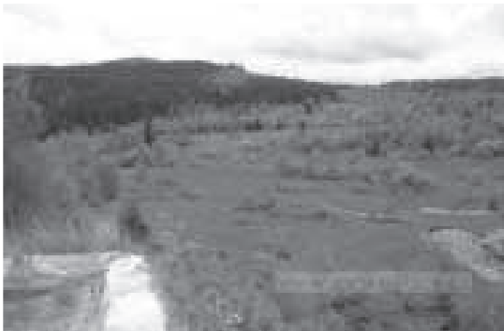
a takto dnes vypadá místo, na kterém stávala.

Není třeba pochybovat, že hospoda burácela smíchem a ve družné zábavě při muzice se končilo druhý den ráno.