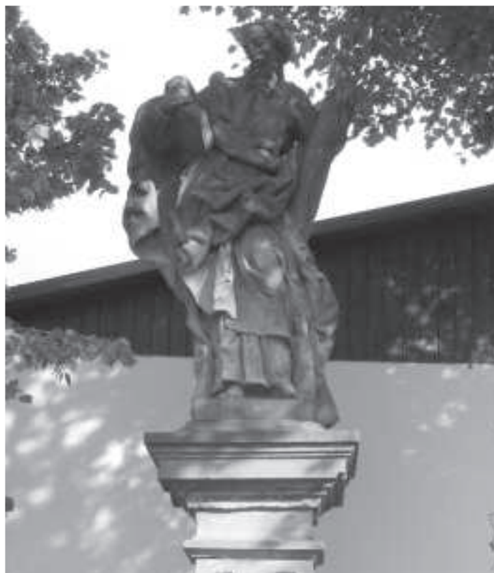
Socha sv. Ondřeje

Na konec jsem nechal jeden problém, který považuji za důležitý. Naše obec má ve schváleném územním plánu celkem 55 hektarů zastavitelného území. To není málo. Počítáme-li 1000 m 2 na jeden dům, je to 550 domů, tedy přibližně 1600 nových