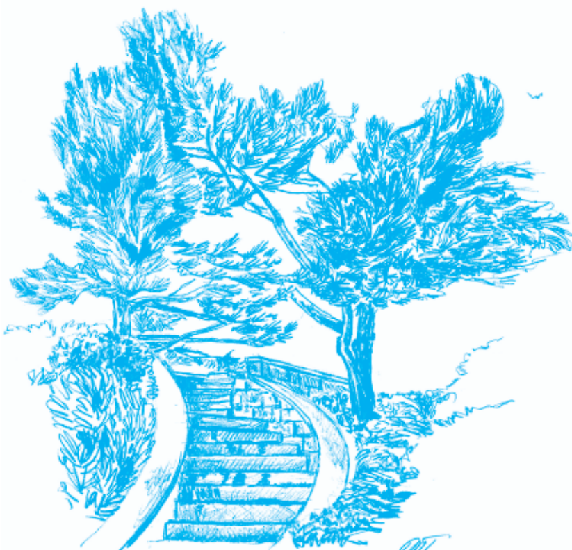
BOROVICE NA HVEZDARNE V ONDŘEJOVĚ