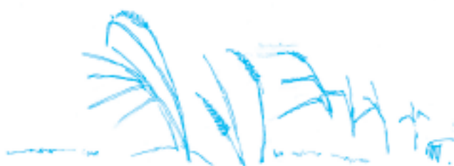
KRAVINA U TŘEMBLAT