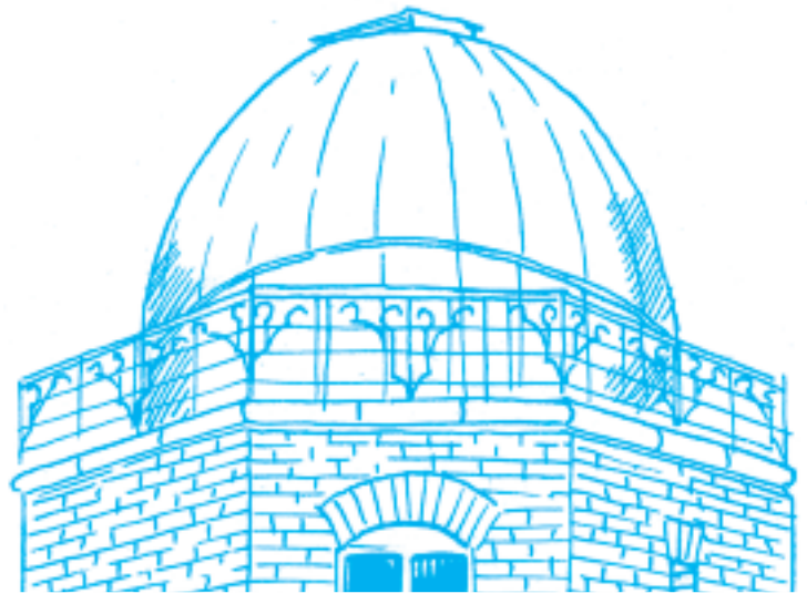
Západní kopule ondřejovské hvězdárny.