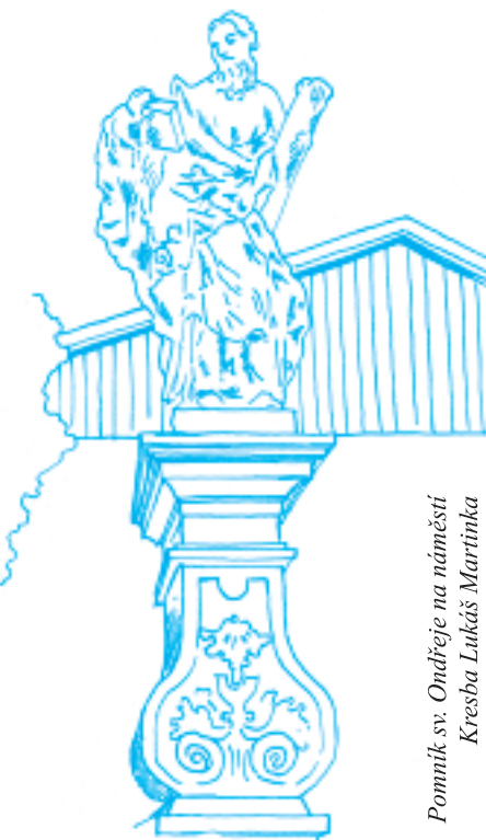
Pomník sv. Ondřeje na náměstí Kresba Lukáš Martinka

Po odbourání betonového soklu se ukázalo, že je třeba opravit a odizolovat základ, na kterém pomník stojí, a dále že jeho nejspodnější dí