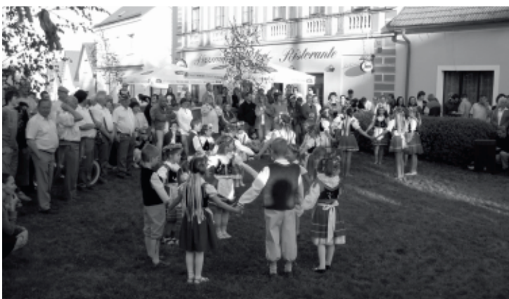
Letošní máje se konají právě v čase, kdy je toto číslo Ozvěn v tiskárně. Proto otiskujeme aspoň obrázek z besedy na loňské májové slavnosti.