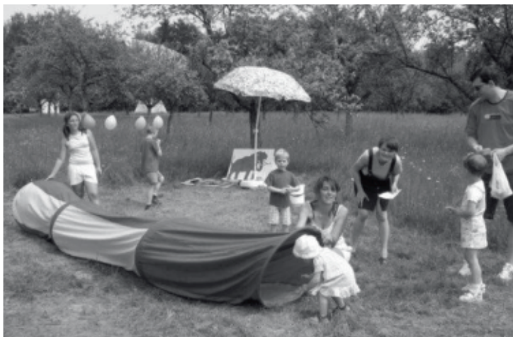
I takhle vypadal dětský den loni