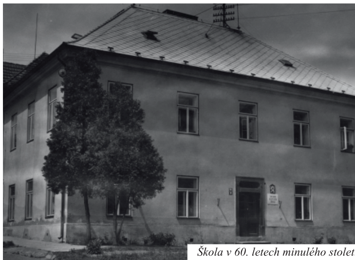
Škola v 60. letech minulého století