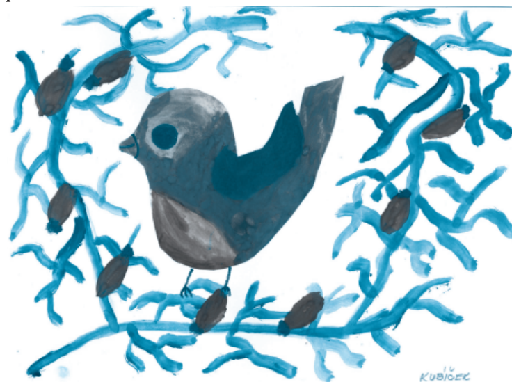
Malba Jiří Kubiček, 4. třída