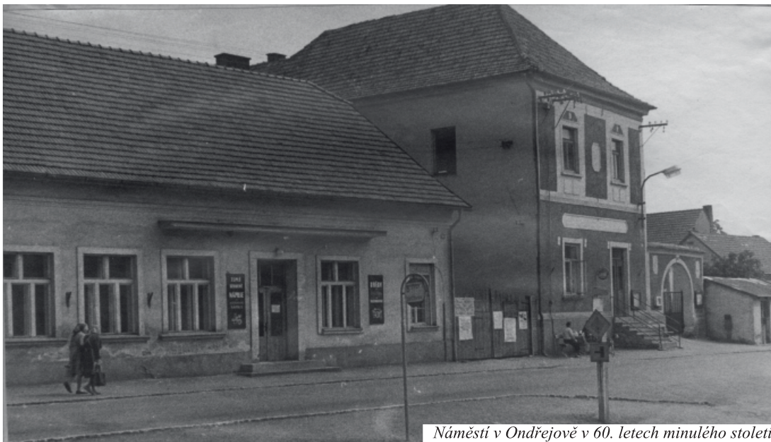
Náměstí v Ondřejově v 60. letech minulého století

Nepostradatelnou osobou pro všechny domácnosti v městečku