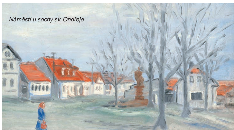
Náměstí u sochy sv. Ondřeje