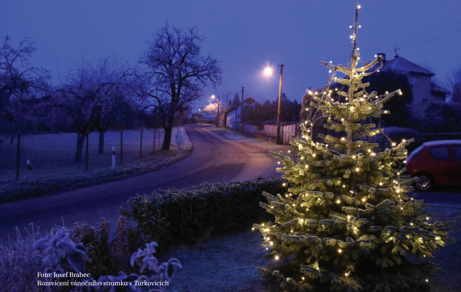
Rozsvícení vánočního stromku v Turkovicích