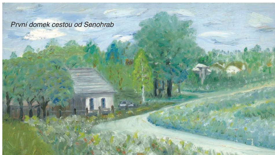
První domek cestou od Senohrab