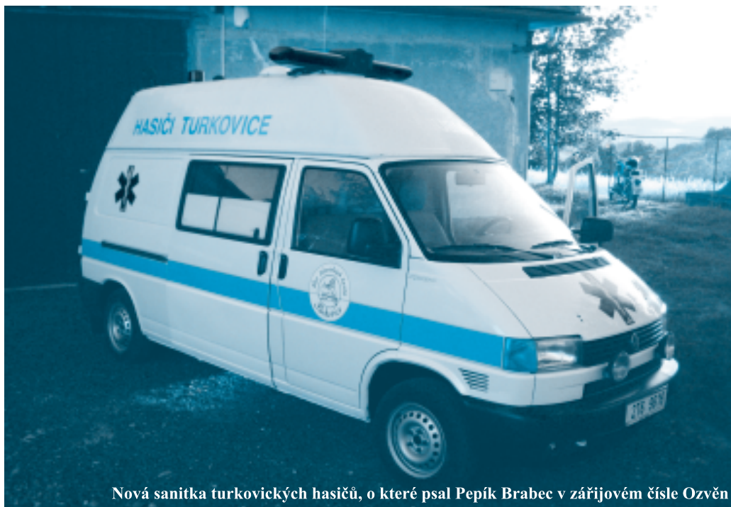
Nová sanitka turkovických hasičů, o které psal Pepík Brabec v zářijovém čísle Ozvěny

Jenomže ministerstvo financí a provozovatelé automatů, kteří na nich vydělávají velké peníze, vymysleli fintu, podle které novější typy, tak zvané "videoloterijní terminály", vlastně nejsou