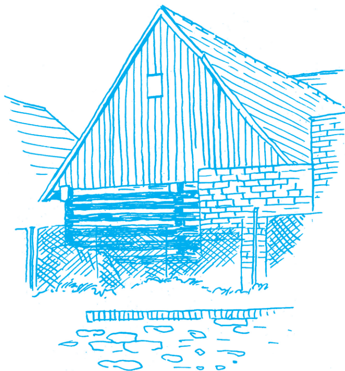
Zadní roubená část domu čp.67 ve východní části náměstí v Ondřejově.

Péče o zvířata měla přednost. Třeba ve žních u nás zůstávala přes den doma jen babička, která měla za úkol uvařit a opatřit domácnost. Na polích pak pracovala široká rodina a najímaly se i sezónní síly. Na některých chalupách, třeba u Dřízhalů, Šálů, Znamenáčků, pracovali trvale kočí, čeledíni nebo dívky na výpomoc, byli tady i Slováci od Prešova. U nás třeba kromě „pražáků“ z rodi-