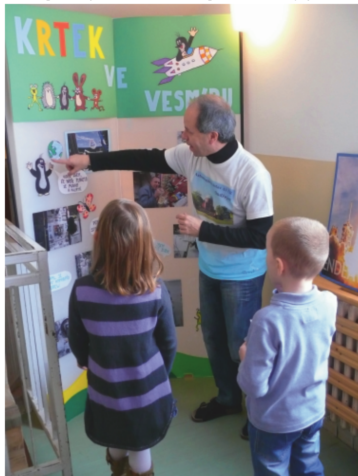
Zápis do první třídy s Krtečkem

Pan ředitel vydal rozhodnutí o přijetí všech přihlášených z naší obce, ostatní dostali oznámení, že rozhodnutí se odkládá. Fakticky ale počítáme s tím, že škola opět otevře dvě první třídy. Pan ředitel chce tuto situaci vyřešit tím, že z dnešní sborovny udělá učebnu, která tam kdysi bývala, a učitelé budou mít svá místa v kabinetech. Je to opravdu jen nouzové řešení, protože kabinety jsou malé