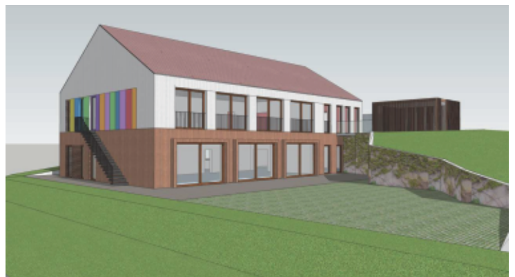
Vizualizace budoucí školky - pohled od jihovýchodu

Jaká je šance? Těžko říct, nechci nic slibovat, vyjít by to mohlo. Česká republika otálela s čerpáním fondů Evropské unie, výzvy