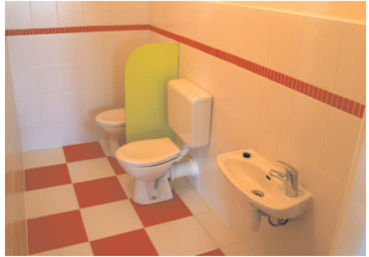
Nové záchůdky pro děti v SKC

Hynku Kašparovi se podařilo získat další dotaci z MAS Říčansko pro vylepšení SKC. Jedna část této dotace bude použita na zřízení záchůdků pro děti v mateřském centru. Až dosud musely malé děti používat záchody pro dospělé, což samozřejmě z mnoha