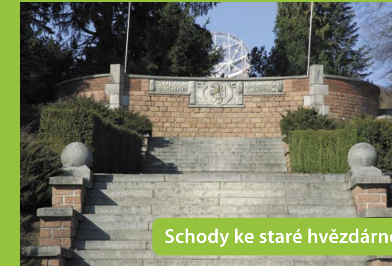
Schody ke staré hvězdárně