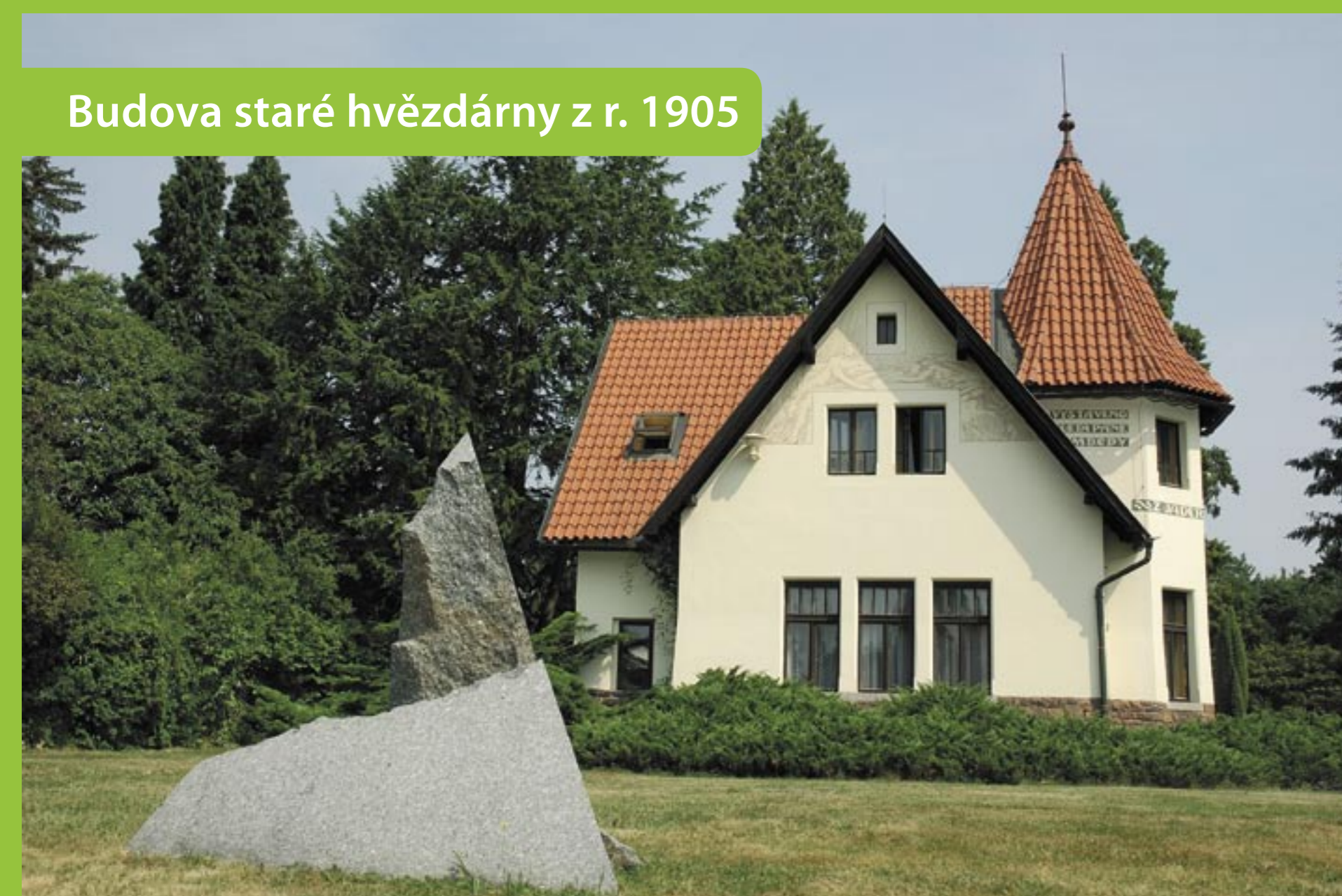
Budova staré hvězdárny z r. 1905