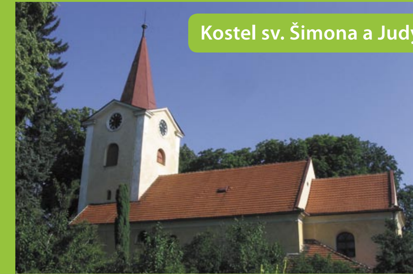
Kostel sv. Šimona a Judy