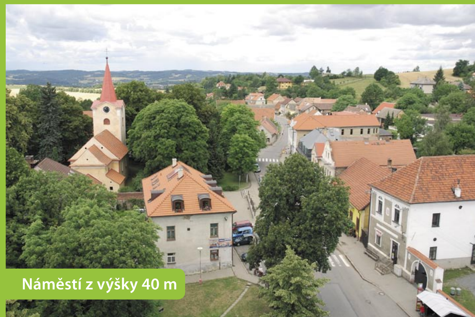
Náměstí z výšky 40 m