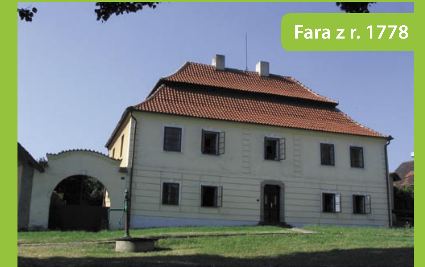
Fara z r. 1778